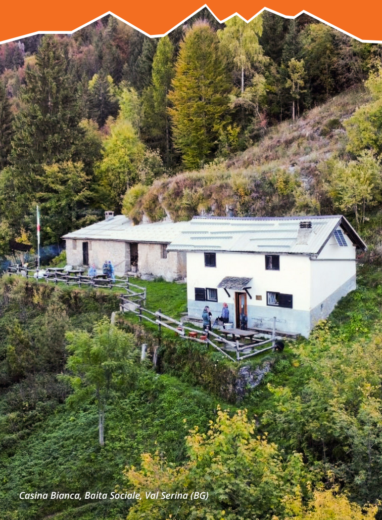
Casina Bianca, Baita Sociale, Val Serina (BG)