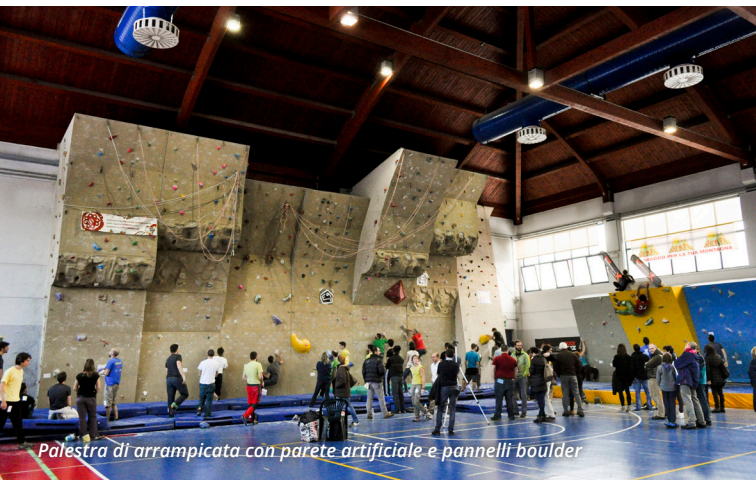
Palestra d'arrampicata con parete artificiale e pannelli boulder

ed allenamento, un approccio decisamente più diretto all'arrampicata sportiva, senza la necessità di utilizzare corde ed imbraghi, protetti a terra da ampi materassi.