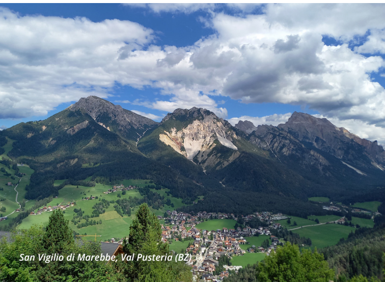
San Vigilio di Marebbe, Val Pusteria (BZ)

Maggiori informazioni sull'organizzazione della vacanza ed iscrizioni a partire da Aprile presso la sede della Sezione.