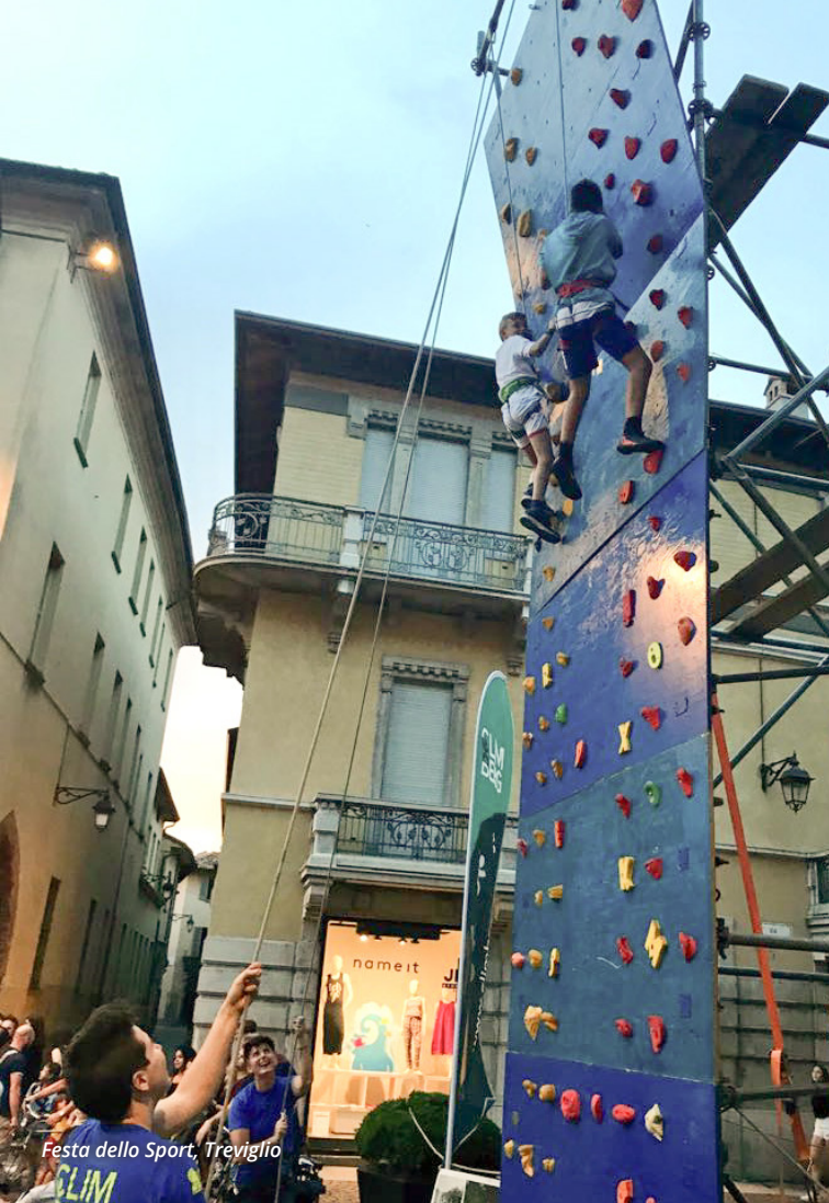
Festa dello Sport, Treviglio