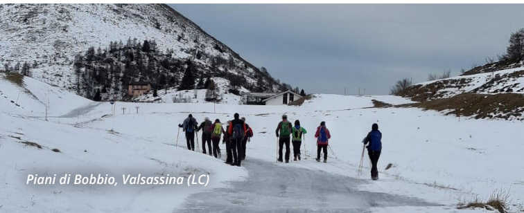
Piani di Bobbio, Valsassina (LC)