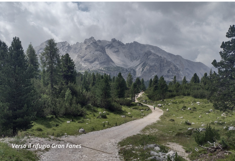
Verso il rifugio Gran Fanes